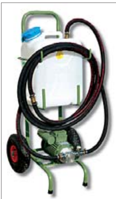
Voraussetzung für die Druckbefüllung: Leistungsstarke Pumpe mit Vorratsbehälter, Feinsieb und hochtemperaturbeständigem Druckschlauch

Für alle verwendeten Materialien ist aber die Temperaturbeständigkeit eine notwendige Voraussetzung. Gerade bei Systemen zur Heizungsunterstützung mit leistungsstarken Kollektoren werden im oberen Abschnitt des Solarkreises (Dachgeschoss) häufiger Temperaturen von deutlich über 170 °C erreicht. Selbst im unteren Abschnitt (Erdgeschoss bzw. Keller) ist nach aktuellen Untersuchungen des ISFH im Bereich der Solarstation zeitweise mit Temperaturen deutlich über 100 °C zu rechnen 1 . Daher sollten z. B. Automatik- oder Handentlüfter vollständig aus Metall bestehen. Probleme kann es auch bei manchen Kugelhähnen geben, denn die Dichtflächen können durch hohe Temperaturen verspröden und daraufhin bei erneutem Gebrauch ihre abdichtende Wirkung verlieren.